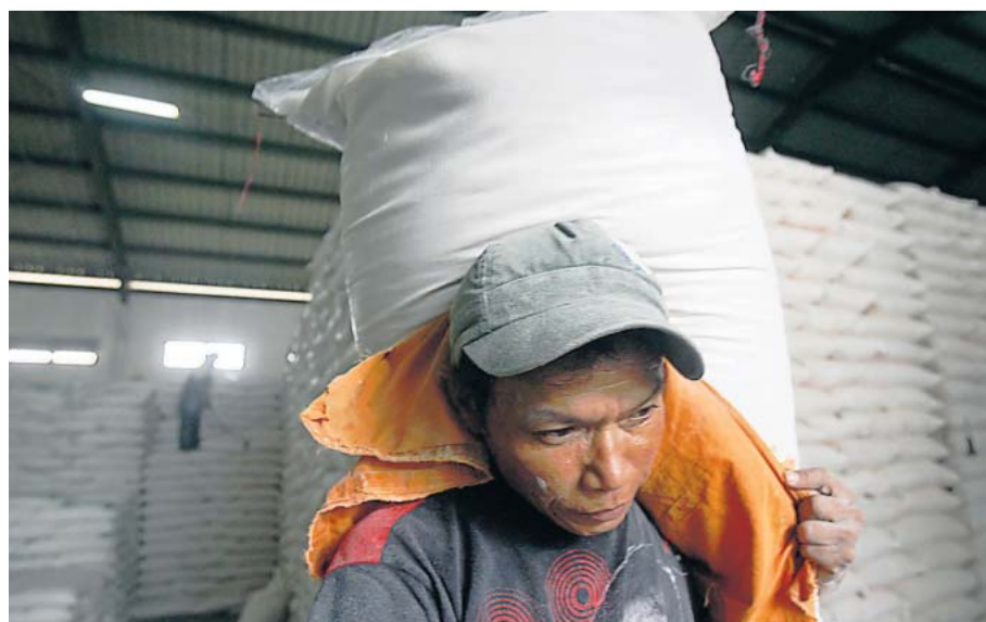
Nicht nur der Handel mit Öl weckt Interesse, auch Zucker ist gefragt.