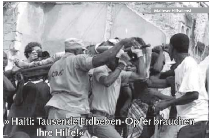
Haiti: Tausende Erdbeben-Opfer brauchen Ihre Hilfe!

Wie lange sich der Preisanstieg vieler Rohstoffe fortsetzt, weiß niemand. Sicher ist: Das Geschäft ist sehr schwankungsanfällig. Mancher Banker, der bereits im Rohstoffgeschäft arbeitet, macht sich daher auch keine Illusionen, wie lange der Aufschwung andauert: „Solange das Geld so billig ist wie jetzt, ist es immer interessant, auf Rohstoffe zu setzen“, sagt er. Wenn die Notenbanken aber anfangen, ihre Krisenhilfen zurückzuführen, und die Zinsen steigen, dann „werden wohl auch die Rohstoffpreise unter Druck geraten“.